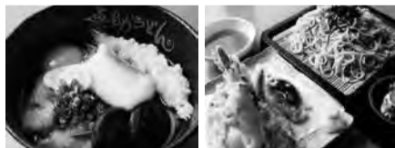
喜助うどん・そば