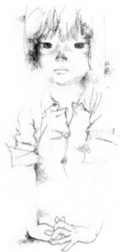
いわさきちひろ 見つめる少女 「わたしがちいさかったときに」(童心社)表紙 1967年

署名方法 職場で署名用紙を配付しております。署名用紙はHPからもダウンロードできます。